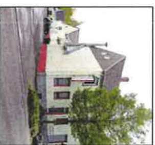
Gastronomie an der Langen Straße. • Foto: Skudlarek

Außerdem befinden sich in dem Gebäude mehrere Wohnungen, die mehrfach wegen Überbelegung auffällig geworden waren. Auch darüber wieder berichtet. Zwischenzeitlich hat der Verkäufer alle weiteren Mietverträge aufgelöst. Anders als an der Heesener Straße wird die SEG mit dem Erwerb somit in keine bestehenden Mietver-