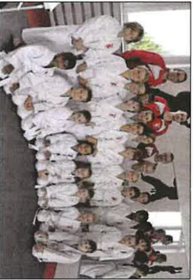
Das Foto zeigt die Karate-Kids der Unterstufe mit den Prüfern und Beisitzern.