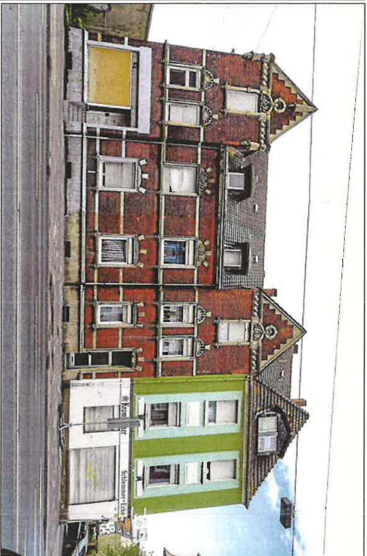
Einen traurigen Anblick bietet seit vielen Jahren das Haus-Ensemble an der Wilhelmstr. 172 bis 176.

den an. Behandelt wurden Themen wie Talente, Berufswünsche, Qualifizierung und Freizeitgestaltung. Die jungen Menschen haben außerdem ihre sozialen und kulturellen Kompetenzen erweitert.