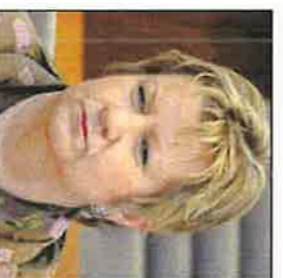
Schulministerin Löhrmann lässt nicht nachschreiben.

Die Opposition versuchte politisches Kapital aus dem Abitur-Kraach zu schlagen: Die schulpolitische Sprecherin der CDU-Landtagsfraktion Petra Vogt verlangte von Aufklärung, was wo schiefgelaufen