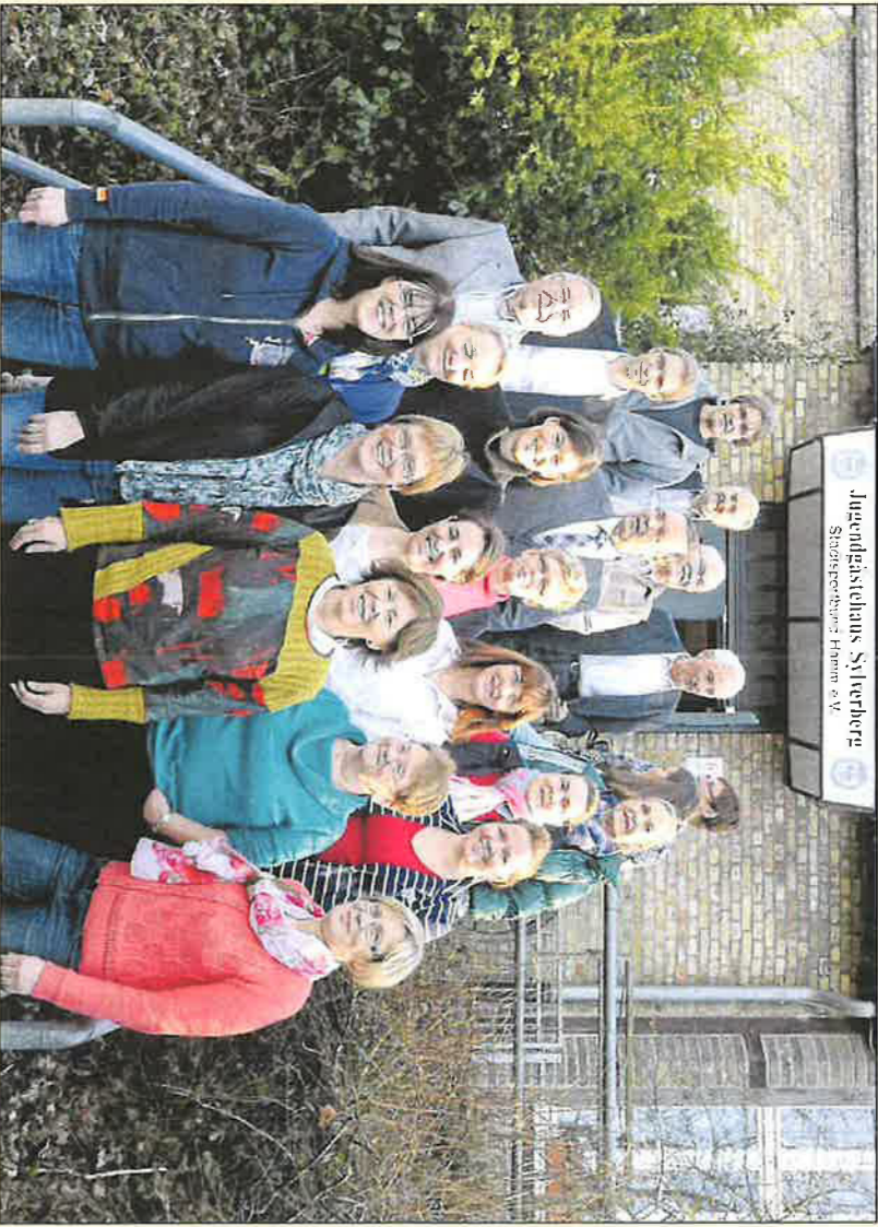
Jugendleistungssportclub Sülpherberg Stützverein: TV Hamm e.V.