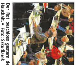
Der Rat beschloss gestern den Haushalt.

HAMM • Der Stadtrat hat gestern die Anhebung der Grundsteuer B um 20 Prozent auf 600 Punkte zum 1. Januar 2015 beschlossen. In gemeinsamer Abstimmung votierten alle Mitglieder der Regierungsfaktionen von CDU und SPD für die Erhöhung. Auch bei den Gebührenthorungen für Abwasser, Musikschule und Straßensenkung gab es bei Schwarz-Rot keine Abweichler.