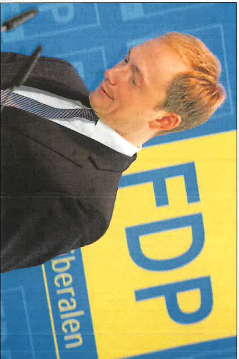
Wirft die Brocken hin: Christian Lindner gab gestern seinen Rücktritt als FDP-Generalsekretär bekannt.