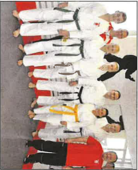
Bestanden die Prüfungen: die Jugendlichen und erwachsenen Karateka des kalten Hamm.