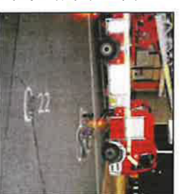
Der Unfall ereignete sich am 9. November.

HAMM • Das Hammer Schöffengericht hat einen 44-jährigen Autofahrer zu zwei Jahren Gefängnis verurteilt. Er hatte am 9. November 2012 gegen 20.30 Uhr auf der Lange Straße mit seinem Auto einen Radler mit voller Wucht erfasst. Der 21-jährige starb an seinen Verletzungen. Der Unfallfahrer wurde der fahrlässigen Tötung und Verkehrsunfallflucht für schuldig befunden. → Lokales