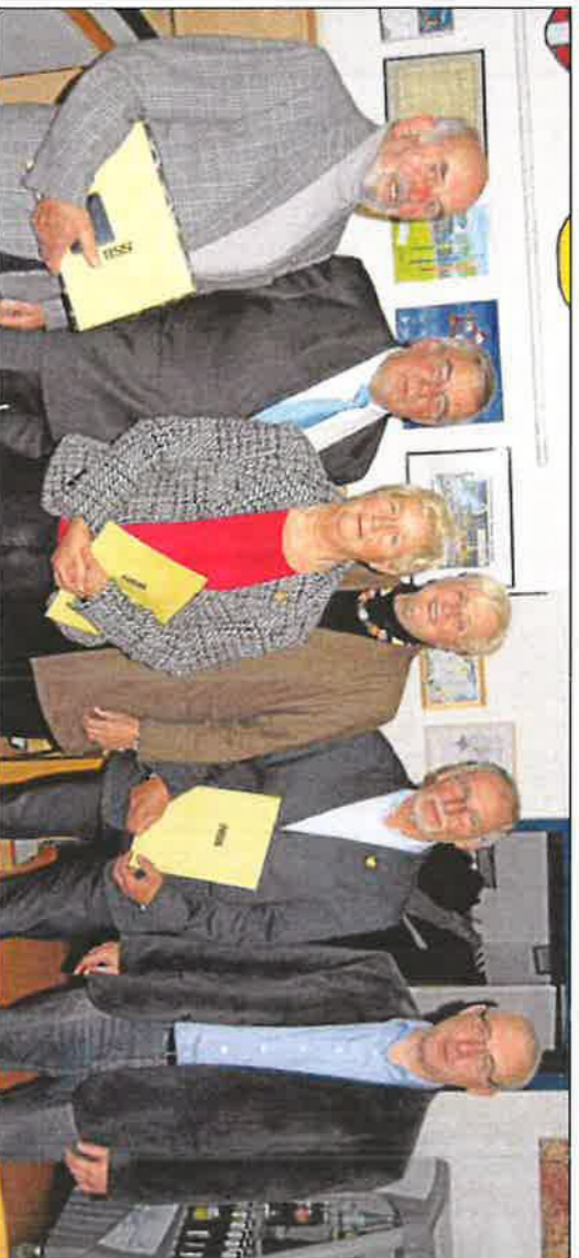
Höhepunkt der traditionellen Jahresabschlussitzung des Stadtverbundes Hamm war wieder die Aufnahme neuer Ehrenmitglieder in den SSB.

Alle Einzel- und Doppelergebnisse unter www.tus59hamm-tennis.de . Menüpunkt: Teams 2014