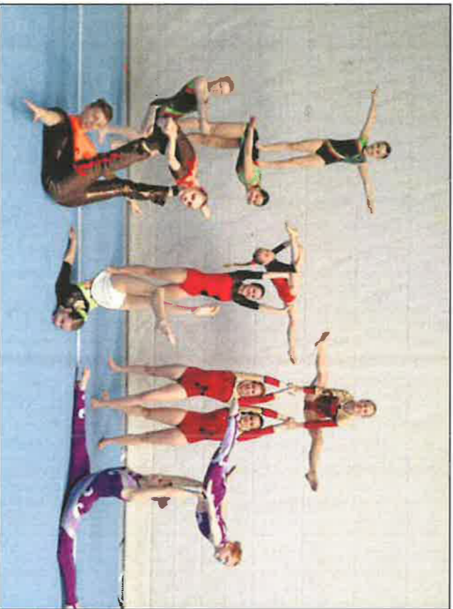
Die einzelnen Gruppen des Hammer SC zeigten bei den nordwestdeutschen Meisterschaften in Göhren auf der Insel Rügen starke Leistungen.