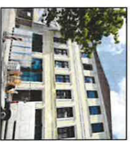
Das Medicum an der Sudstraße ist fast fertig.