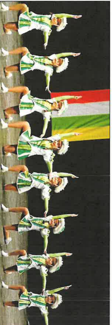
Die Junioren-Tanzgarde der KG Grün Weiß Hamm qualifizierte sich für die Deutschen Meisterschaften. • Foto: pr

TANZEN Juniorengarde der KG GW Hamm löst Ticket zur Deutschen Meisterschaft HAMM • Die Junioren-Tanzgarde der KG Grün Weiß Hamm hat sich bei den 22. norddeutschen Titelkämpfen in Halle an der Saale für die Deutschen Meisterschaften qualifiziert. Die finden am kommenden Wochenende in westfälischen Halle statt. Bereits einen Tag vor dem großen Nummer machten sich die Junioren mit ihrer Trainerin und einigen Fans auf den Weg zu der lang erwarteten Meisterschaft in Sachsen-Anhalt. Obwohl die jungen Damen aus Hamm an Meisterschaftstrag aus gesundheitlichen Gründen auf eine Tänzerin verzichten mussten, gingen sie hochmotiviert und kämpferisch auf die Bühne. Die Junioren-Tanzgarde an der diesjährigen Meisterschaft teilnehmen wollte sie ihr Bestes zeigen und die KG gut vertreten. Am Ende mussten sich die Mädchen knapp geschlagen geben. Sie belegten mit 426 Punkten den vierten Platz. Damit gehörten sie allerdings zu den sechs besten Gruppen des Nordens die als lesant das Ticket für die Deutschen Meisterschaften im westfälischen Halle lösen. Die U15-Tänzerinnen der KG mussten ihre bereits erwordene Qualifikation ausgeben. Das schwerwiegende Verletzungspech zog sich durch die ganze Saison und machte einen Start unmöglich. • Foto: pr