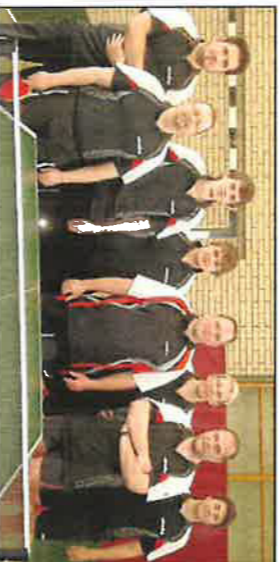
Das erfolgreiche Team von Westfalia Rhyrnern wurde mit 36:0 Punkten Meister.