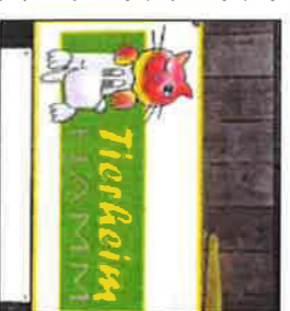
Das Tierheim vor ungewisser Zukunft.

HAMM • Die Bemühungen für einen Rettungsplan des Tierheims mit angeschlossener Pension sind gescheitert. Eine von der Mitgliederversammlung des Tierschutzvereins Hamm und Umgebung eingesetzte Kommission habe kein tragfähiges Konzept für einen Weiterbetrieb der Einrichtung am Gallberger Weg in Eigenregie gefunden, teilte der Vorstand gestern mit. → Lokales