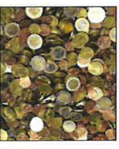
Wer sich bei der Sparkasse mit Wechselgeld eendeckt, muss dafür bezahlen.

HAMM • Die Sparkasse lässt sich bei der Ausgabe von Münzrollen nicht einwickeln. 30 Cent werden seit Monatsbeginn pro Rolle verlangt. Begründet wird die Verpflichtung, nun auch Münzgeld vermehrt auf Echtheit überprüfen zu müssen. Das produzierte zusätzliche Kosten. Die Volksbank gibt Münzrollen weiterhin kostenlos aus. → Lokales