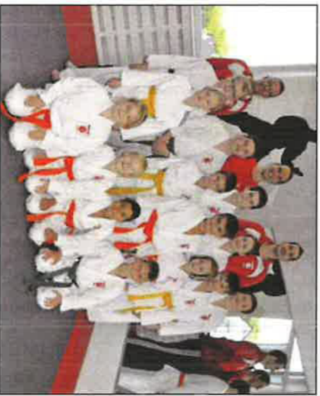
Ebenfalls erfolgreich: die Karate-Kids der Oberstufe mit den Prüfern und Beisitzern.