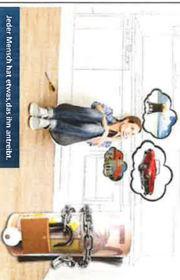
Jeder Mensch hat etwas, das ihn antreibt.